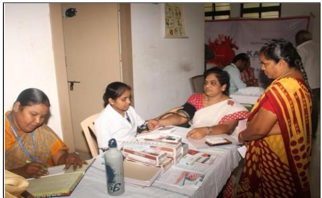
Medical camp at KLEF - Physicians and volunteers with faculty and underprivileged