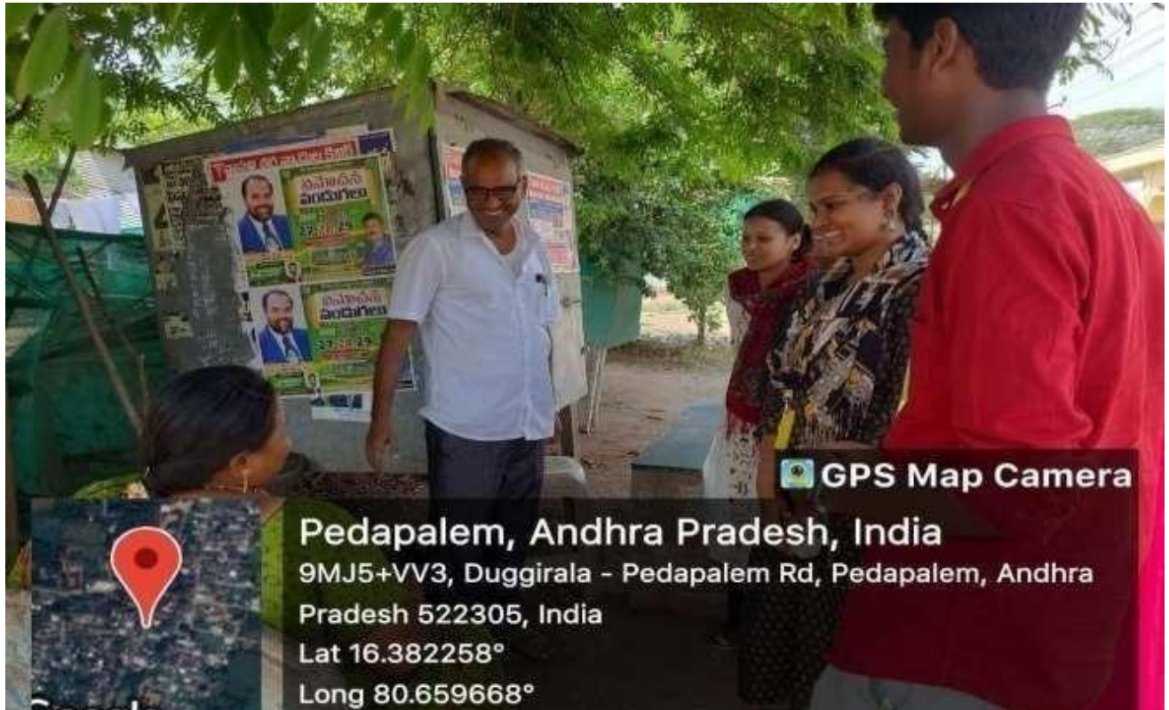
NSS Volunteers briefing villagers about better nutrition food on 26/03/23.