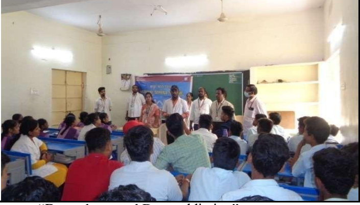
KLEF NSS Programme officer created Awareness on "Drug abuse and Drug addiction"