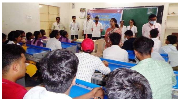
KL University Pharmacy NSS Volunteers and staff giving presentation on Drug abuse & Drug addiction on 04/02/23