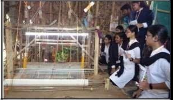
KLEF Law Volunteers interact to Villagers to awareness Legal Literacy