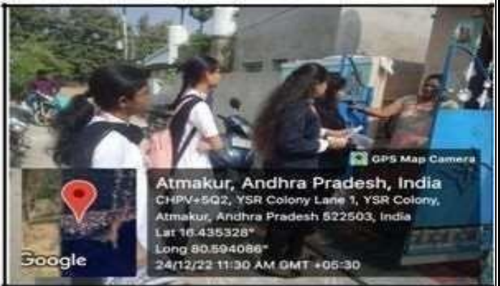
KL University College of Law Volunteers awareness campaign on LegalLiteracy on 24/12/22