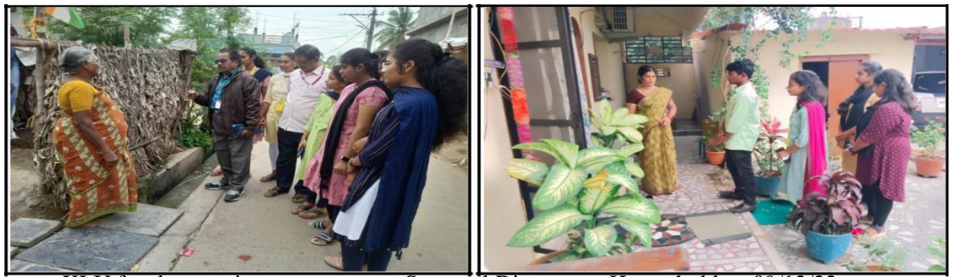
KLU faculty creating awareness on Seasonal Diseases to House holders 09/12/22