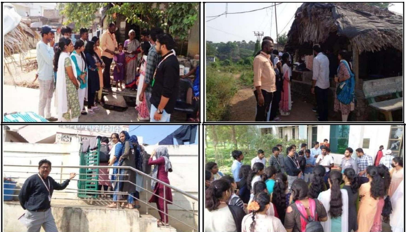
Students Giving Awareness on Skill Development to villagers.