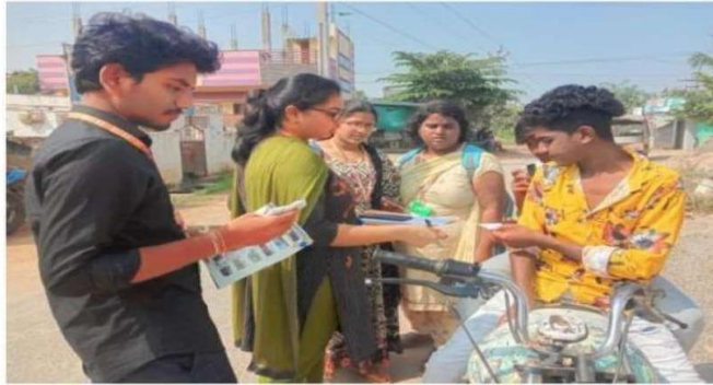
NSS Volunteers talking to village youth and giving awareness skill development centers on 16/11/22