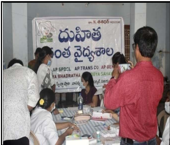
Duhitha hospital doctors conducting dental checkup to villagers on 15/07/22