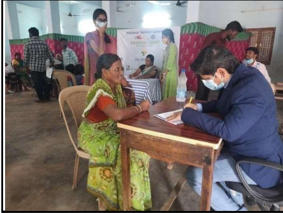
Inaugural of Health camp at vaddeswaram village & patients check up on 15/07/22