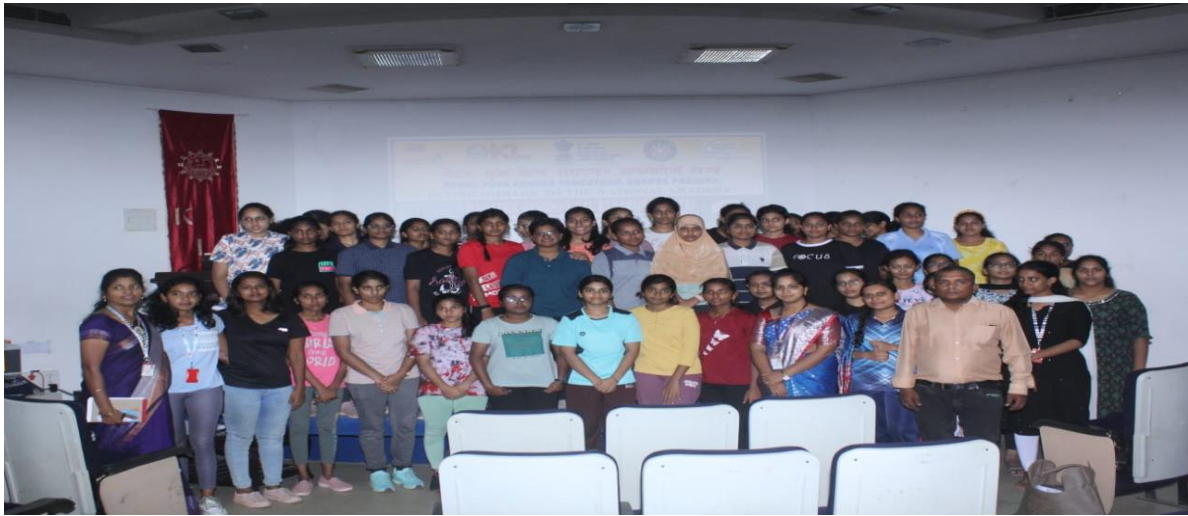
10 Andhra Girls Bn., Y2023 Selected cadets for NCC