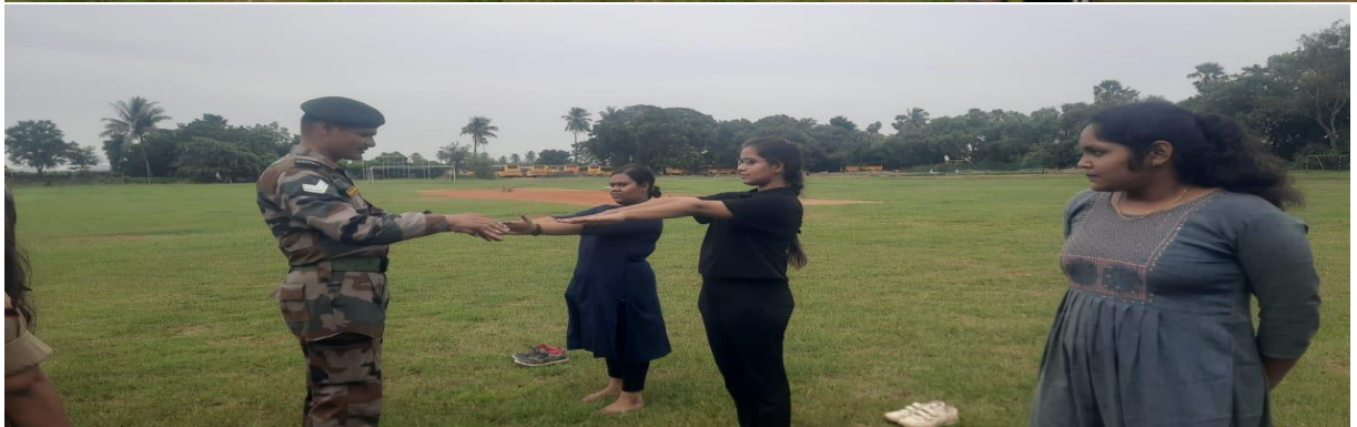
Selection Process by 10 Andhra Girls Bn., PI Staff from on Enrolment day