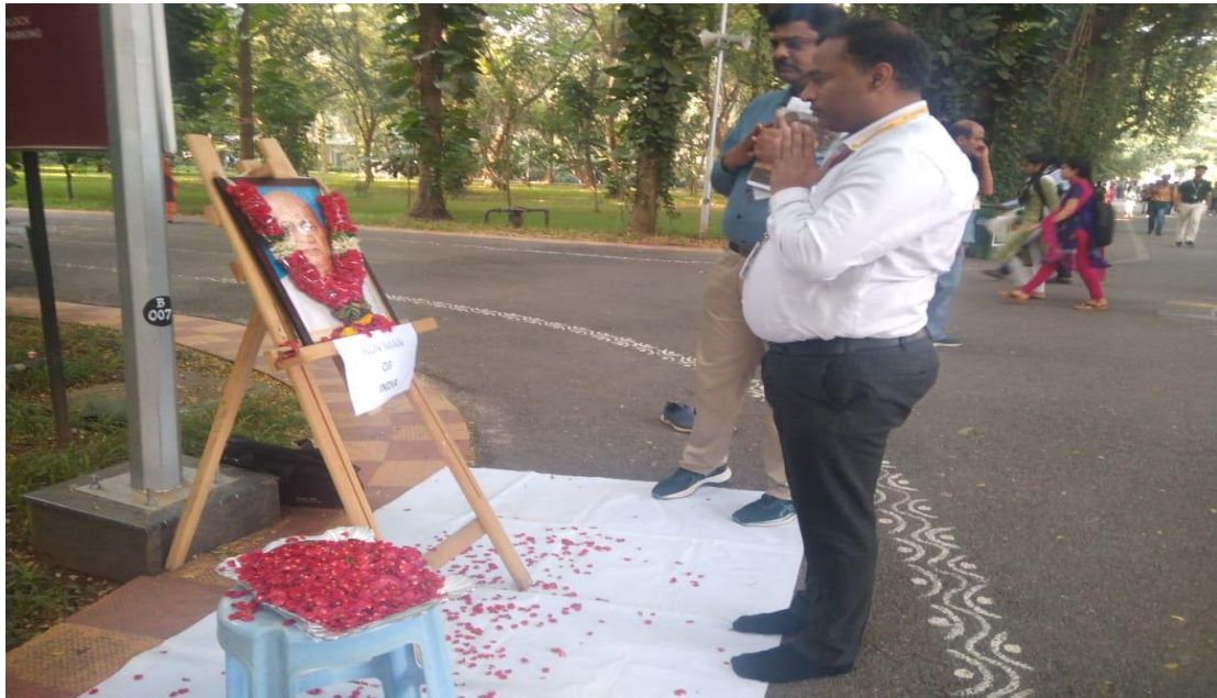
Garlanding and floral to the Great Leader Iron Man on the occasion of “National Unity Day”