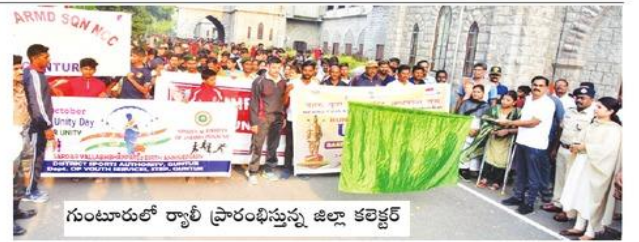
గుంటూరులో ర్యాలీ ప్రారంభిస్తున్న జిల్లా కలెక్టర్