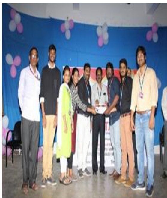
Certificates Distribution on Inter Collegiate Dramatic Competitions on 08-02-2019