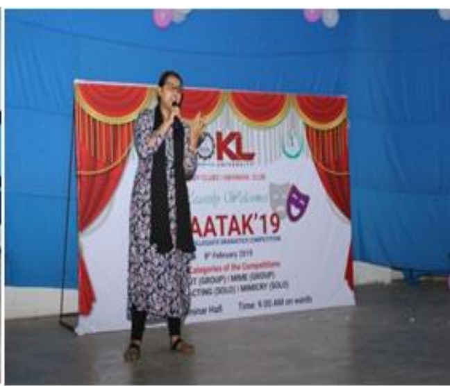
Performance by students in Inter Collegiate Dramatic Competitions on 08-02-2019