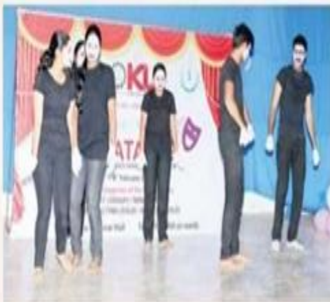
విద్యార్థుల నాటక ప్రదర్శన